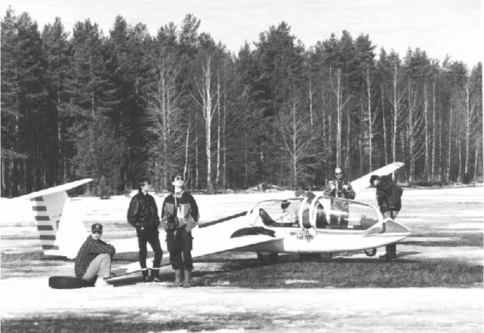
Sapliinit talvipäivillään