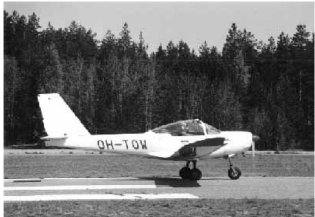
Suhinu uudessa ulkoasussaan