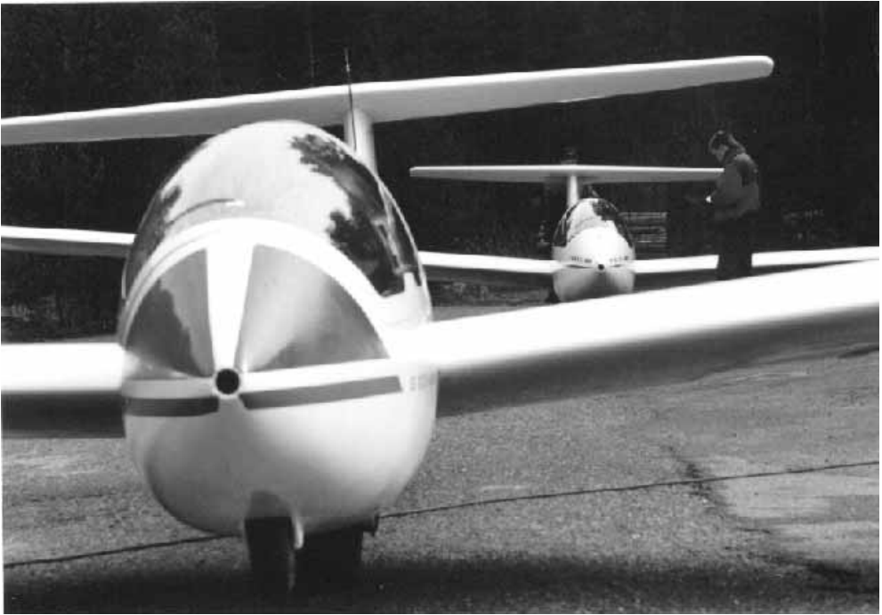
Kaksitasoja Räyskälässä?

Vili kutsui omia oppilaitaan sapliineiksi koko kurssin ajan ja kukaan ei vielääkään tiedä miksi. Välillä tuntui siltä, kuin Vilikin olisi kaivannut opettajaa, ainakin sukkaostoksilla. Tennissukkien koko ei aina tosiaankaan ole sama kuin Vilin bootsien koko. Vilin takki muuten kaipaa jo parsimista, eli työtunteja lienee luvassa halukkaille. Mono esitteli kurssilla uusinta lakkimuotia lyhyellä lipalla varustetulla "Kennametal" -lippiksellä. Matkalentovarustukseen lisättäväksi kurssi suosittelee Hankkija-lippistä, joka takaa farmarin kuin farmarin suosion pellolla.